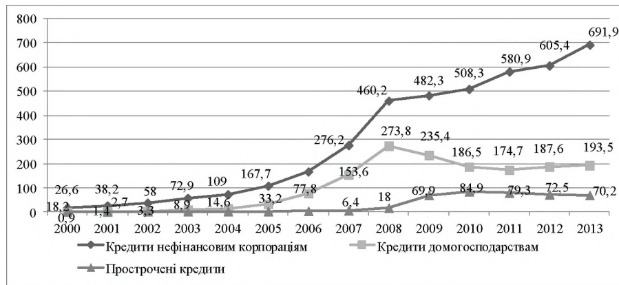
Рис. 2. Динаміка окремих показників кредитного портфеля банків України у 2000–2013 рр., млрд грн.