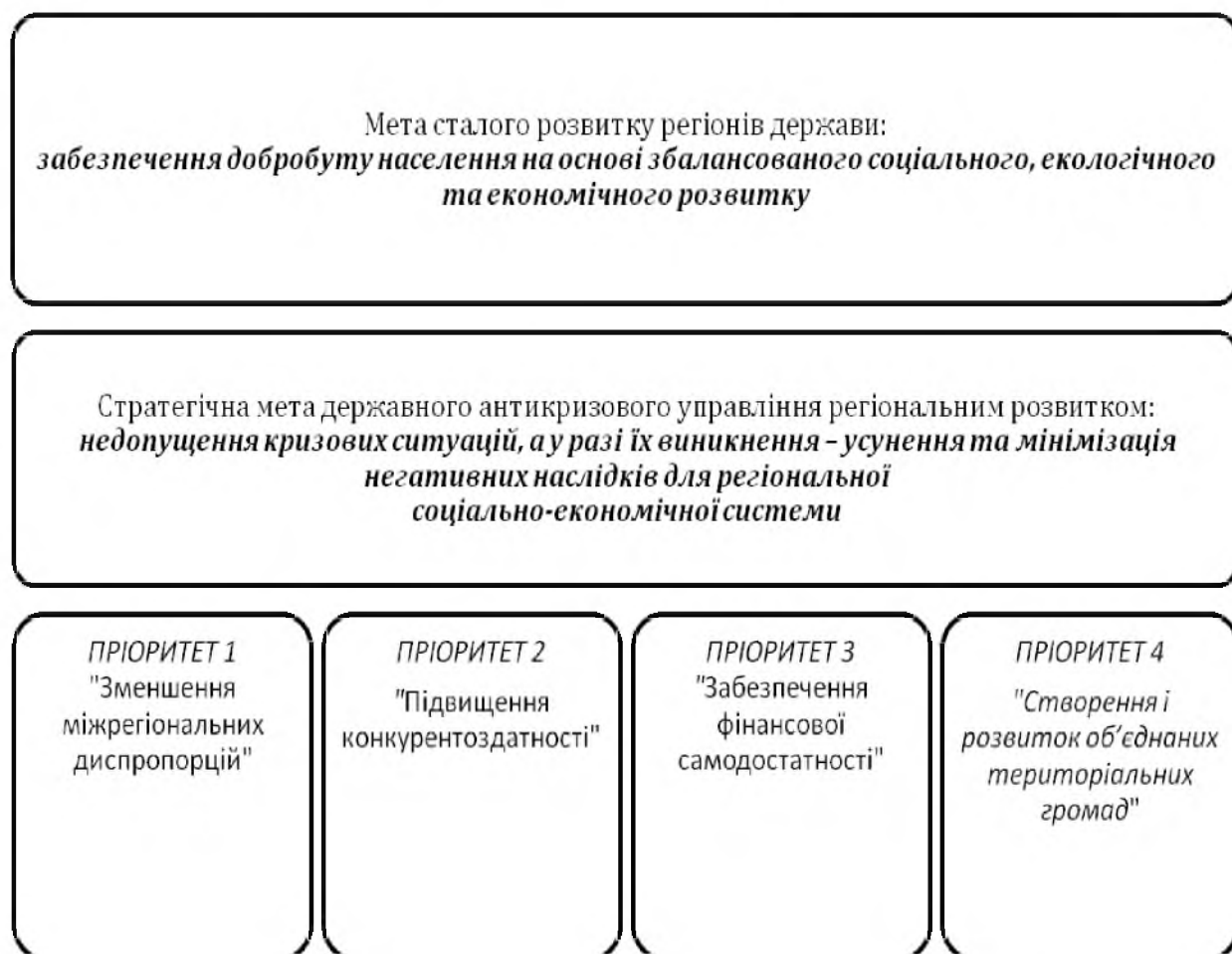
Рис. 4.11. Мета та пріоритети державного антикризового управління регіональним розвитком

виробництва або високий рівень безробіття у бідних регіонах є втратою потенціалу та можливості для країни в цілому 238 .