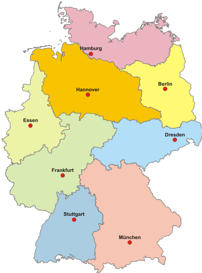
Рисунок 1.1 – Центри митних розслідувань (Zollfahndungsämter) ФРН